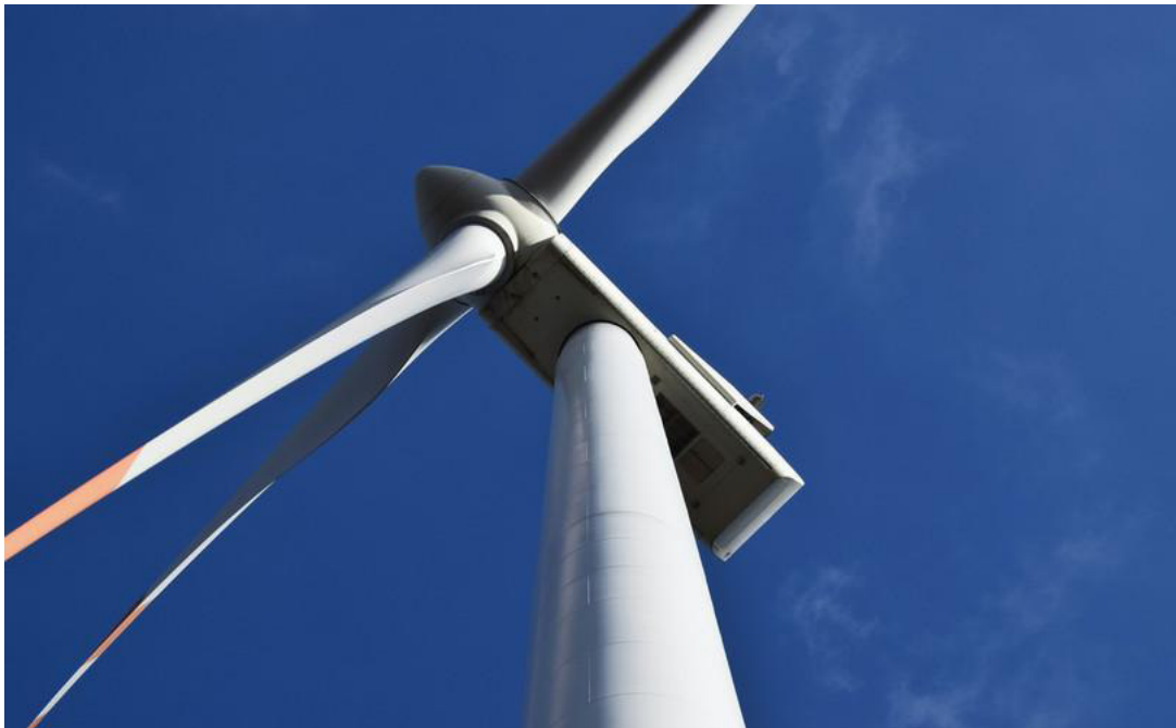
Le parc éolien du Mont de Boveresse était suspendu depuis 2014. (photo d'illustration).

Le projet revient sur le devant de la scène plus tôt que prévu. Le développeur ennova va poser trois mâts de mesure du vent et de l'activité des chauves-souris. La Commune de Val-de-Travers salue une action bénéfique pour le débat public